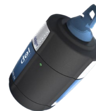
DOL53/DOL51 ammoniak sensor

Samenwerken met omgevingsdiensten voor je doelvoorschriften vergunning gaat makkelijk doordat je jouw gegevens in elk formaat kunt delen, terwijl jij de baas blijft over jouw data.